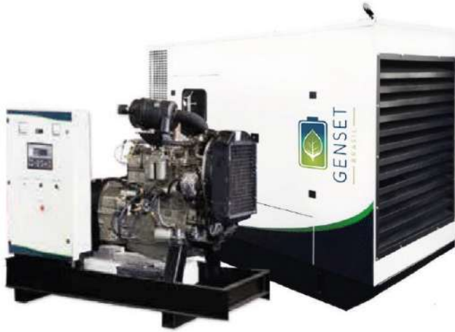
A imagem apresentada pode não refletir a configuração real.